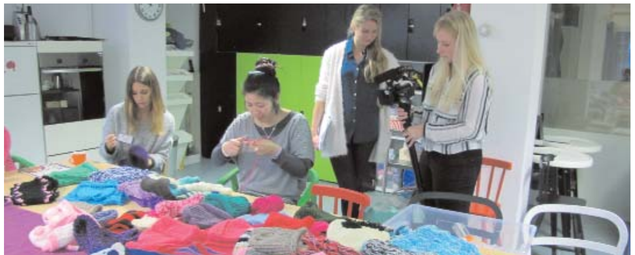
Een Goed Idee in uitvoering: Breien voor Sinterklaas, vrijwilligers maken kleurrijke sjaals & mutsen voor kinderen van 4 t/m 12 jaar

Hebt u voor de uitvoering van zo'n Goed Idee enige financiële ondersteuning nodig? Dan stelt de gemeente Groningen incidenteel een bedrag beschikbaar. Lees hieronder de stappen die u kunt volgen om uw idee uit te voeren: