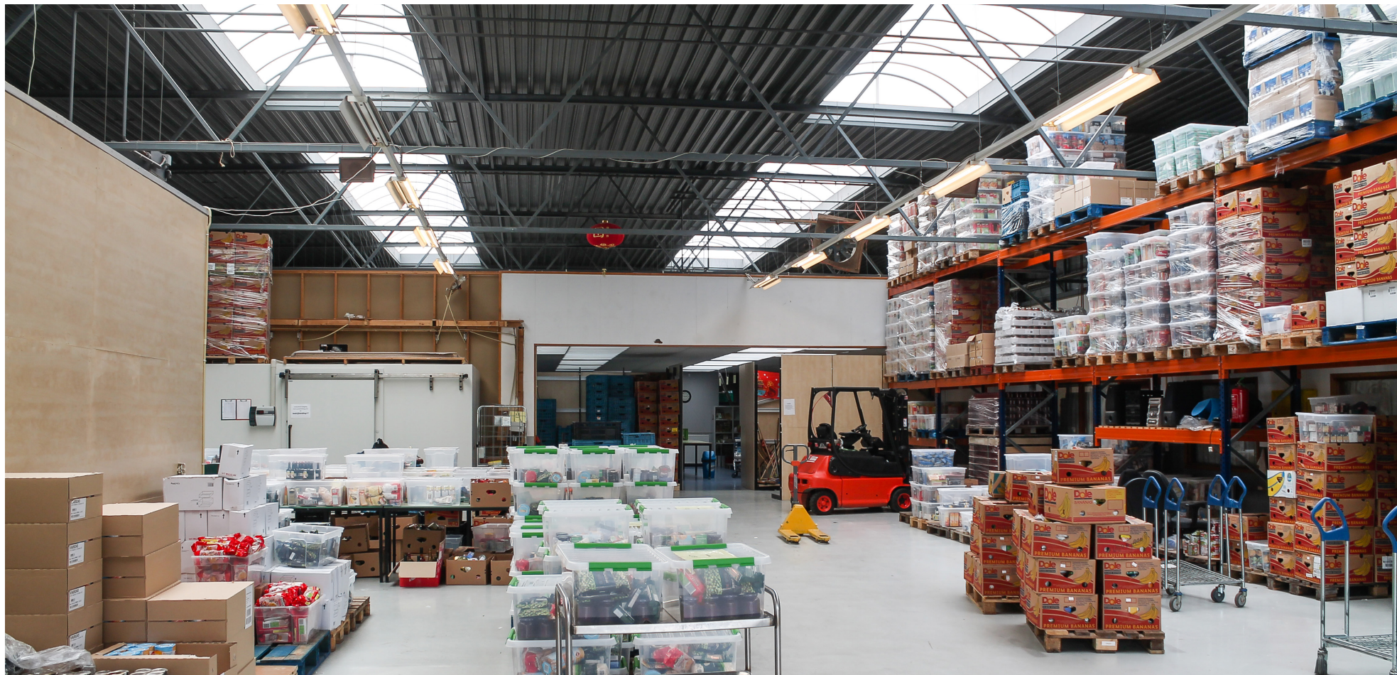
Opslag stadse voedselbank

Huis aan huis, Stad Groningen Jaargang 1 • Nummer 1 • juni 2014